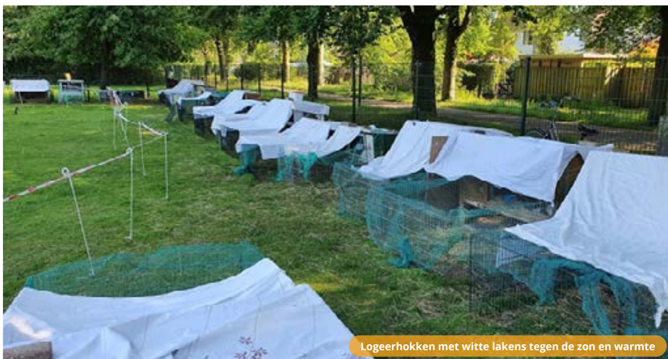
Logeerhokken met witte lakens tegen de zon en warmte

Afgelopen zomermaanden stond ons weiland weer vol met hokken voor de vakantieopvang, er hebben in totaal 78 konijnen, 20 cavia's, 6 kippen en 2 hamsters bij ons gelogd. Hier kwam een strakke planning bij kijken, om voor zoveel mogelijk mensen hun dier te kunnen opvangen tijdens de vakantie. Volgende zomer gaan we proberen dit nog wat efficiënter aan te pakken, en zullen er dus wat veranderingen doorgevoerd worden m.b.t. het aanvragen van een plekje voor de dieren. Wilt u verzekerd zijn van een plekje voor uw dier tijdens de volgende zomervakantie? Stuur dan op tijd een mailtje om een plekje voor uw dier(en) te reserveren.