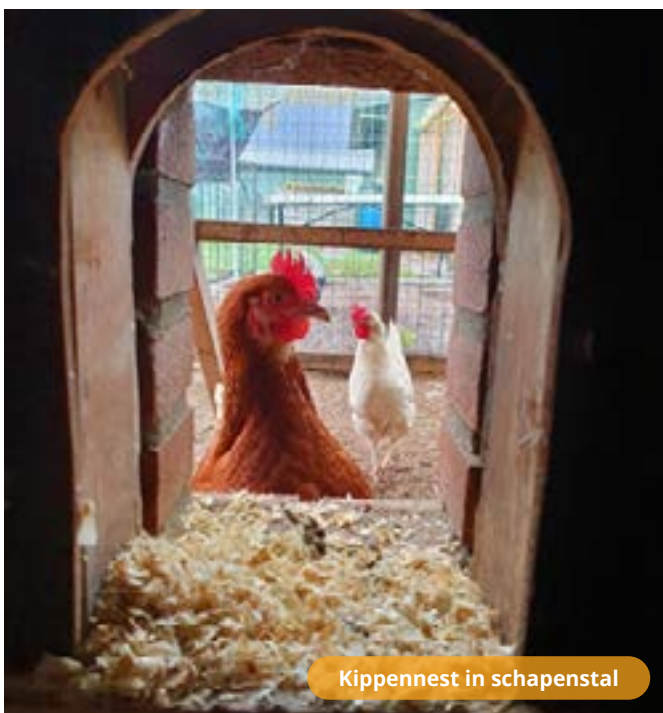
Kippenest in schapenstal

Heb je toevallig al eens een ezel voorbij zien komen in Driebergen? Dat klopt, af en toe gaan wij met de ezeltjes wandelen door het dorp, of een stukje door het bos. De ezels Olaf en Dora vinden het erg leuk, en kijken dan nieuwsgierig om zich heen.