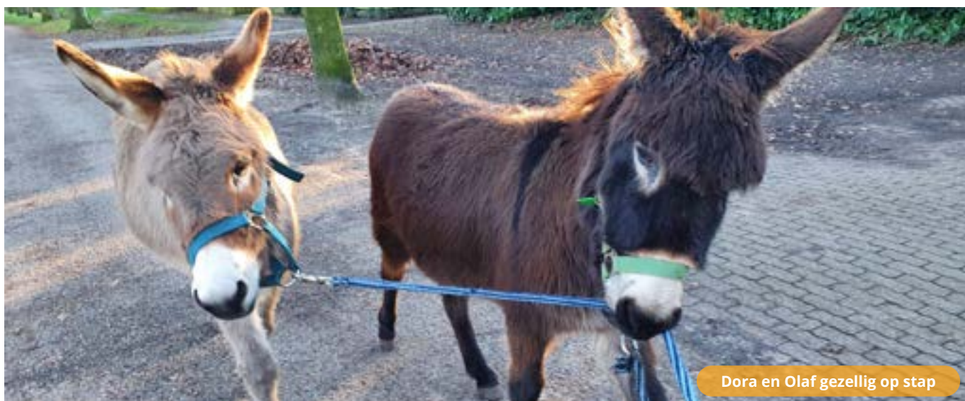
Dora en Olaf gezellig op stap